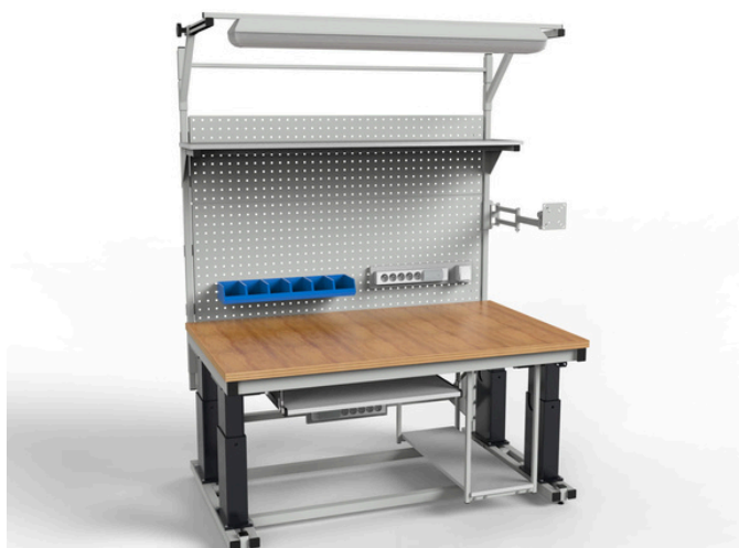
Stół warsztatowy heavy-duty SSMWRE-0915 z elektryczną regulacją wysokości 50 cm