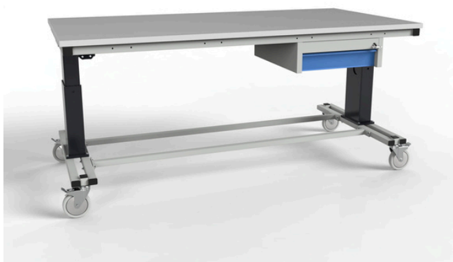
Stół montażowy mobilny SMREMK6 elektryczną regulacją wysokości w zakresie 50 cm