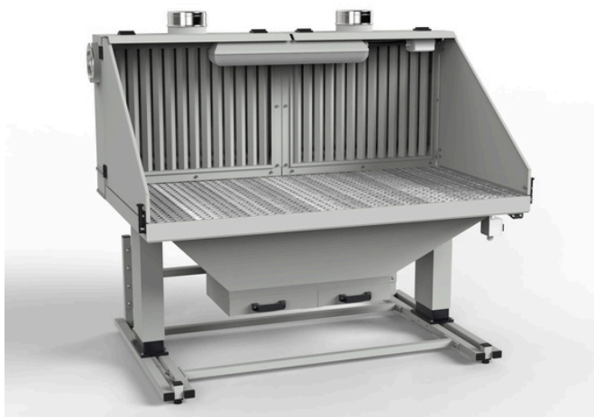
Stół szlifierski SSRE-0915 z elektryczną regulacją wysokości w zakresie 50 cm