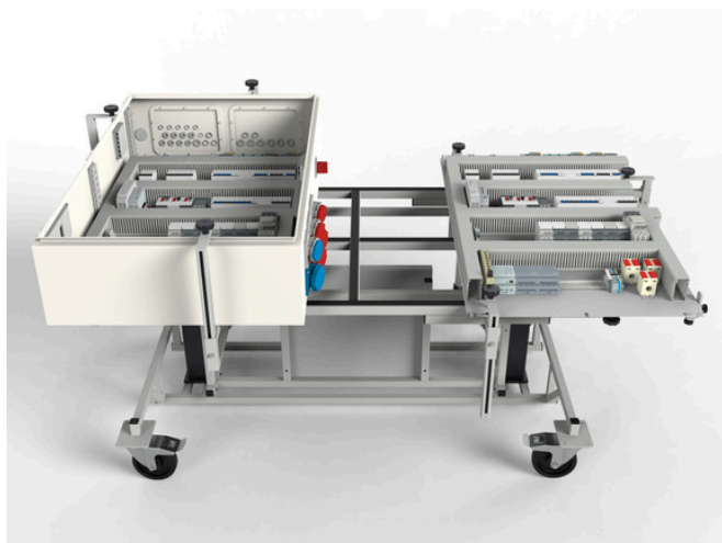
Stół montażowy do prefabrykacji rozdzielnic SMRE-SPEC-08373 z elektryczną regulacją wysokości i pochyłu (37 cm / 89°)