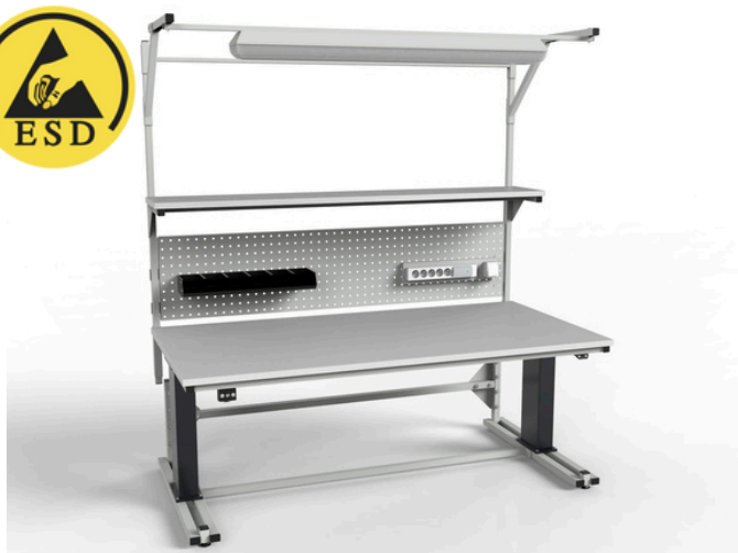
Stół montażowy SMREPC/ESD z elektryczną regulacją wysokości w zakresie 50 cm